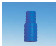
Entlüftungsstutzen / vent connection C1.0605.01