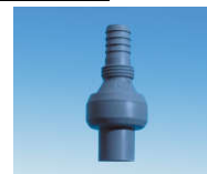
Rückschlagventil mit Entlüftung / non-return- valve with venting 3004.53.00